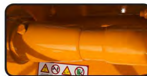
Wolnobię na tulei