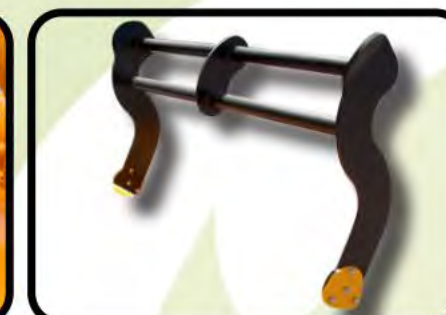
Rama pchająca hydrauliczna lub mechaniczna